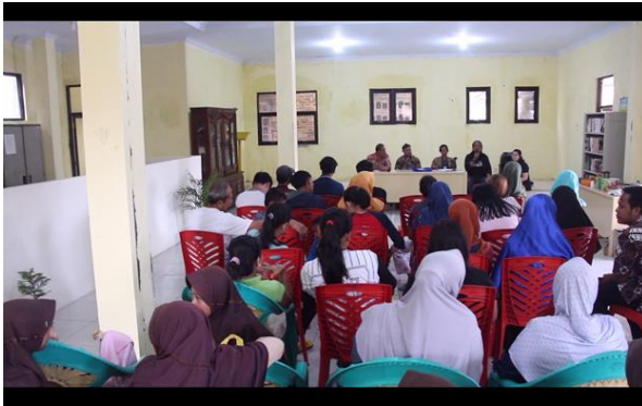
Gambar 1.3 pengarahan serta sosialisasi program yang akan dilakukan di desa Padabeunghar.