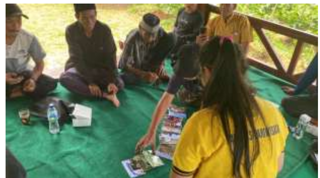
Sumber: Dokumentasi Tim PkM UPH (2025)