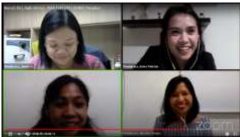
Gambar 11. Sesi Kuis Interaktif