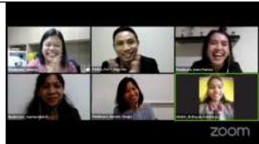
Gambar 12. Pengisian Form Evaluasi