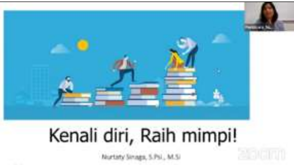
Gambar 9. Ice Breaking