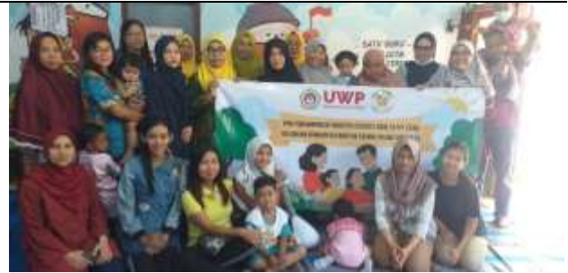
Gambar 1. Pendampingan Positive Parenting