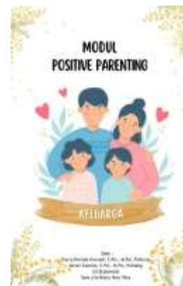
Gambar 2. Modul Positive Parenting