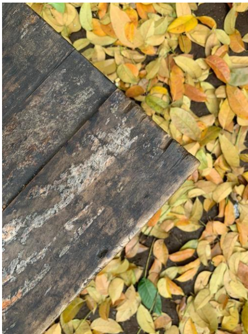
Gambar 3 : Segitiga Sumber :

Objek pada fotografi memiliki bentuk serupa atau pola yang seragam pada keseharian yang memiliki kesamaan dengan kedekatan dalam objek foto. Hal ini dapat diketahui bagaimana kedekatan dengan bentuk yang sama pada persepsi anak dapat dipahami melalui sebuah objek fotografi yang menjadi suatu media pembelajaran.