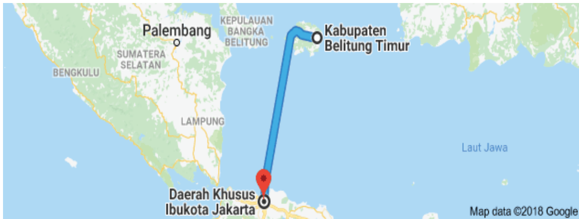
Gambar.1.1. Peta Lokasi PKM