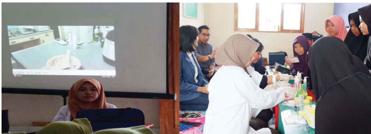
Gambar 6. Penjelasan materi pengabdian dengan media video dan demonstrasi produk