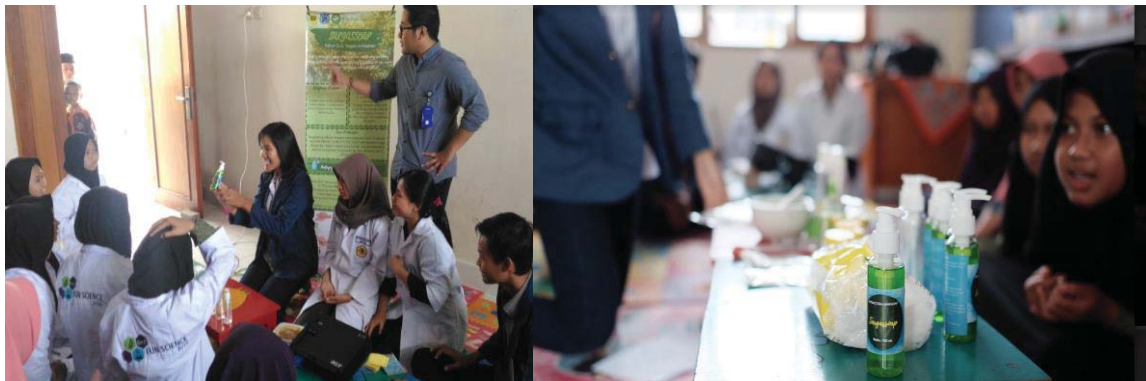
Gambar 5. Penjelasan materi pengabdian