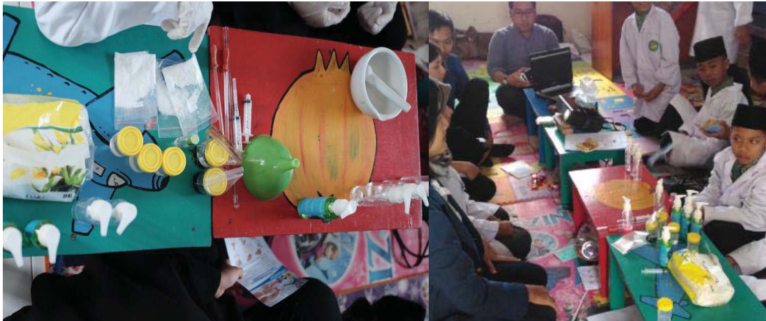
Gambar 4. Peserta sedang membuat sendiri handsoap antibakteri