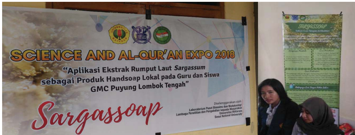
Gambar 1. Spanduk dan banner kegiatan pengabdian

Kegiatan pengabdian ini dilaksanakan pada tanggal 15 September 2018 berlokasi di GMC Puyung. Jumlah total peserta yang hadir dalam acara pengabdian ini adalah 40 siswa. Dalam pelaksanaannya acara dilakukan secara bergelombang, tiap gelombang diikuti oleh 10 peserta, sehingga dalam pelaksanaannya dilaksanakan empat gelombang. Penyampaian dilaksanakan secara bergelombang untuk efektivitas diskusi dan paraktik dalam pembuatan sediaan sabun antibakteri oleh masing-masing peserta.