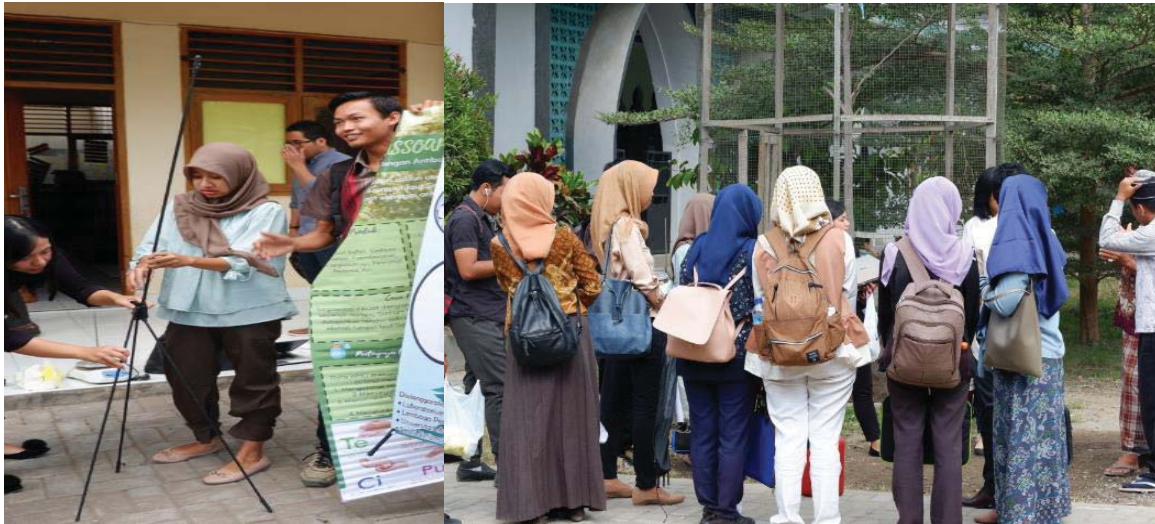
Gambar 2. Persiapan pelaksanaan kegiatan pengabdian