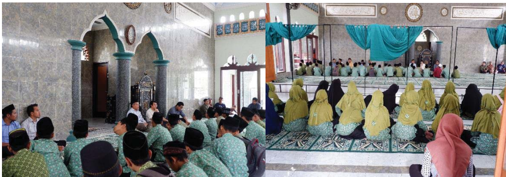
Gambar 3. Pembukaan acara pengabdian dilaksanakan di masjid GMC

Pengabdian ini merupakan implementasi hasil formulasi dan uji efektifitas sediaan krim anti UV. Sehingga dalam pelaksanaannya guru dan siswa dilatih untuk membuat sendiri krim anti UV, dengan demikian guru dan siswa menguasai teknik pembuatan sediaan krim anti UV dengan bahan aktif rumput laut. Selain itu dalam pelaksanaan pengabdian ini guru dan siswa juga mendapatkan informasi mengenai pentingnya krim pelindung kulit untuk mencegah dampak negatif radiasi UV seperti kanker kulit.